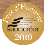
Saucisson au taureau